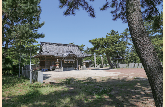
国指定史跡 弓削島荘遺跡「弓削神社」（構成資産） 愛媛県指定名勝 法王ヶ原

日時 令和8年7月11日（土） ※雨天決行 10：20～12：00 受付9：50～