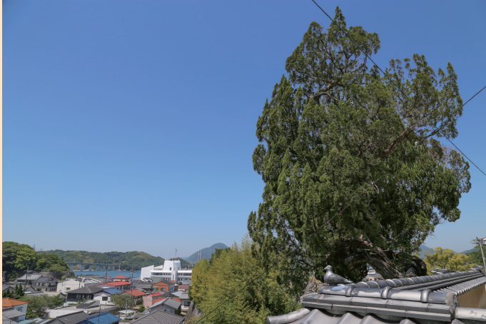
潮音寺の柏榎（ビヤクシン）と下弓削の町並み