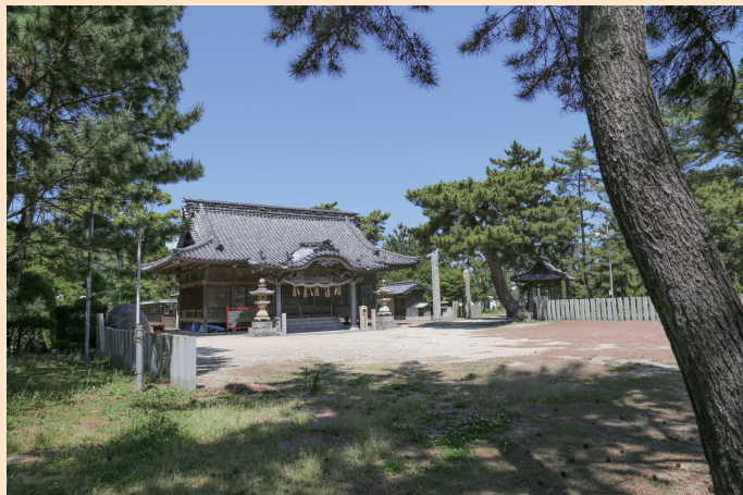
国指定史跡 弓削島荘遺跡「弓削神社」（構成資産） 愛媛県指定名勝 法王ヶ原