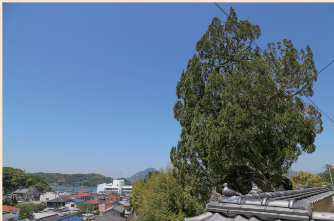
潮音寺の柏榎（ビヤクシン）と下弓削の町並み