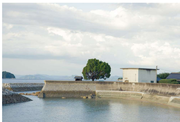
「ぽつんとした木」 カウブ 竜一 (上島町 現イギリス在住)