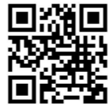
つうえんポータル

子ども一人につき、月10時間まで利用可能 ※施設によって、1回あたりの利用時間や利用可能日が異なります。 ※当日キャンセルされた場合、利用時間としてカウントされます。