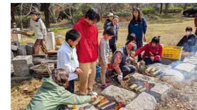
▲ 竹筒ご飯作り体験の様子

した。 当日は、自由に誰でも絵を描けるスペースを設けたほか、ポールや大縄で遊んだり、火おこしや竹筒ご飯作り体験などを行いました。