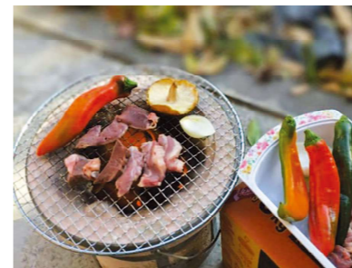
▲ 休日に行ったイノシシBBQ