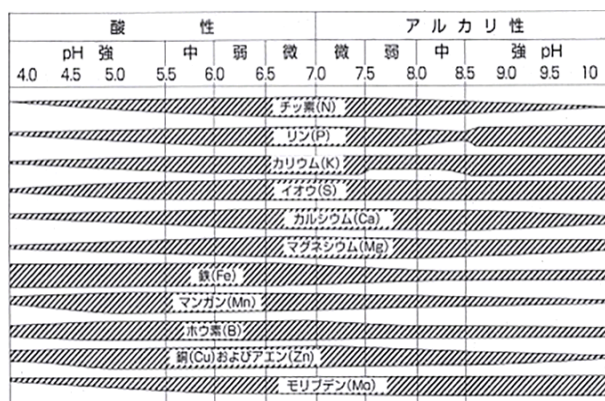
図1 土壌pHによる肥料成分の溶解度

② 作物の好適な土壌pH 主要な農作物の好適な土壌pHは表1のとおりです。多くの農作物は、中性土壌（土壌pH 6.5～7.0）でよく育ちますが、例外としてジャガイモやブルーベリーは弱酸性を好みます。 アルカリの土で栽培するとジャガ