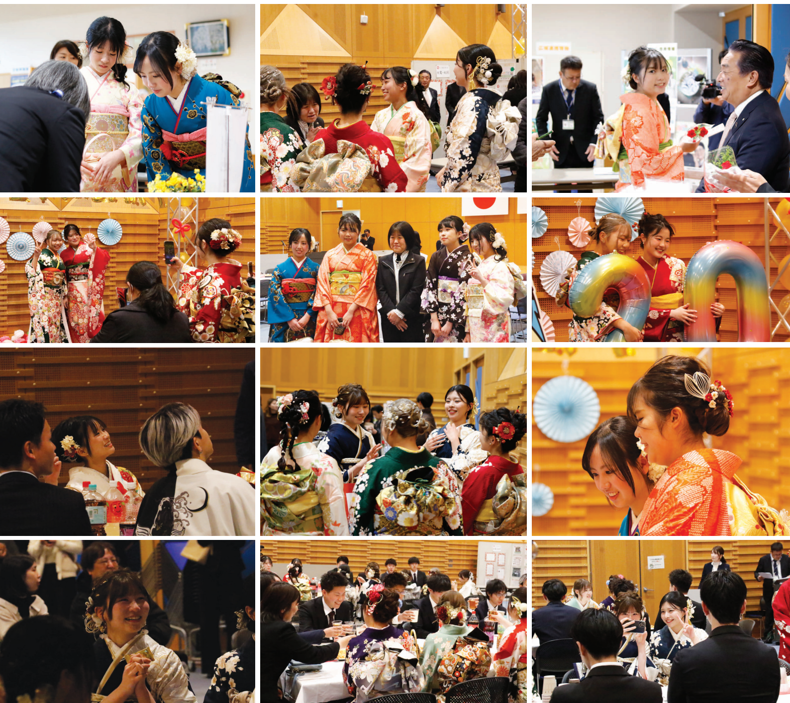
写真説明：令和8年上島町二十歳を祝う会（1月3日）