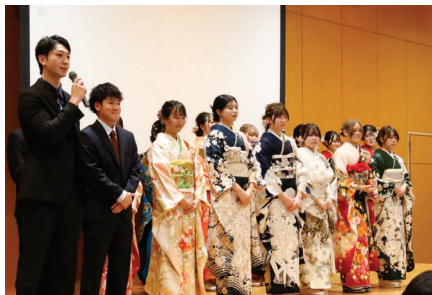
▲ 弓削・生名地区 自己紹介