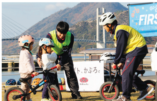
▲ 交通安全教室で園児に教える高校生