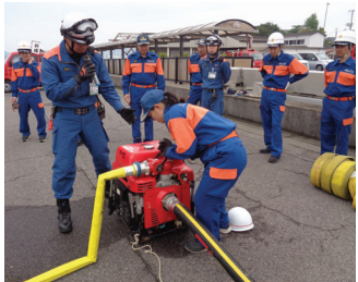
幹部・新人合同研修

本業を持ちながら、ボランティア精神により、地域の安全と安心を守るため活躍している非常勤特別職の地方公務員です。