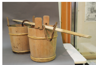
▲井戸水を運ぶ道具「担い桶」（魚島）

好きなだけ水を使用することができますが、とても便利でありがたい事なんだと改めて実感します。