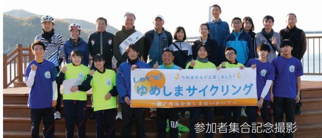
参加者集合記念撮影

弓削ひだまり公園で開催された「Let's ゆめしまサイクリング～瀬戸内海を楽しまないかい～」は、第5回自転車甲子園で2度目の最優秀賞を受賞した弓削高校の生徒が企画したイベントです。