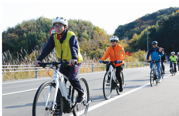
▲ E-BIKE ガイドツアーで参加者をガイドする高校生

高校生がコース案内役となるE-BIKEガイドツアーでは、ゆめしま海道の魅力やおすすめスポットを丁寧に紹介し、参加者の皆さんからは、生徒たちのわかりやすい説明に大変感心したとの声が寄せられました。また、園児を対象とした交通安全教室では、高校生が左右確認の方法を実演しながら、楽しく交通ルールを学び、園児たちも安全意識を高めることができました。本イベントを通じて、弓削高校生は企画力・実践力を伸ばすことができ、次のステップへとつながる貴重な経験となりました。今後の更なる弓削高生の活躍を期待しております。