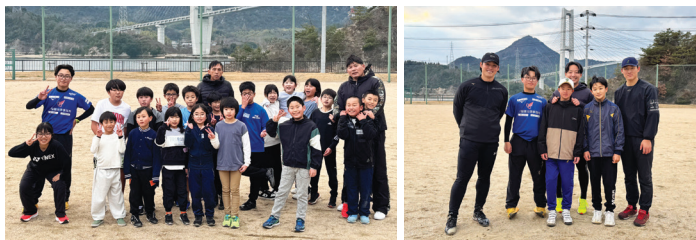
▲ 講師の方たちと記念撮影 左:「走る」の参加者 右:「投げる」の参加者