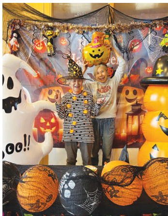
▲ 海の駅ふらっとにて撮影