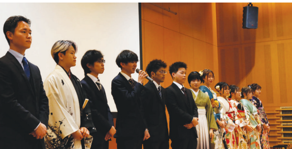
▲ 岩城地区 自己紹介