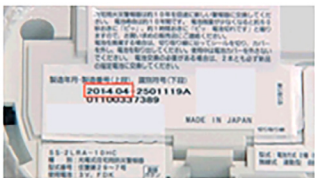
本体裏に製造年月を記載