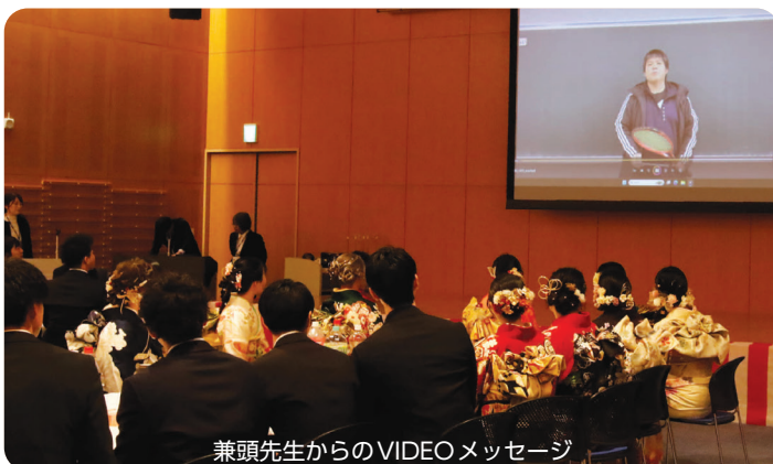
兼頭先生からのVIDEOメッセージ