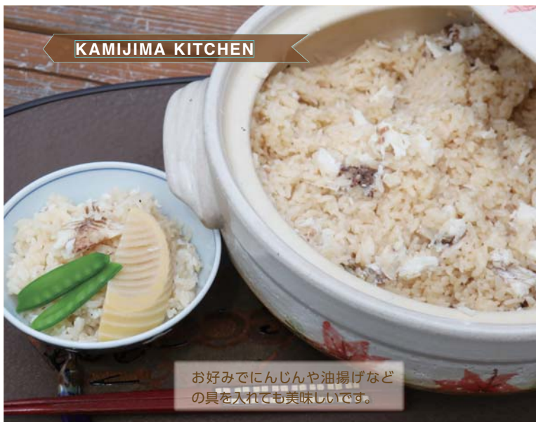
お好みでにんじんや油揚げなどの具を入れても美味しいです。