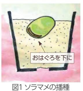
図1 ソラマメの播種

発芽後、本葉が2枚ぐらいになったら、うね幅180cm、株間60cmの間隔に植え付けます。うねにシルバーマルチすることでアブラムシの発生を防ぐことができます。