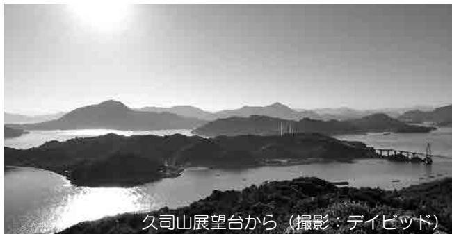
久司山展望台から