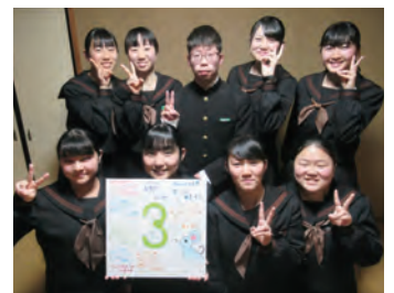
卒業・卒塾した3年生

別れがあれば出会いあり。4月からは新しい講師が塾にやってきます。次はどんな花が咲くのか。ゆめしま未来塾の次の彩りをお楽しみに。