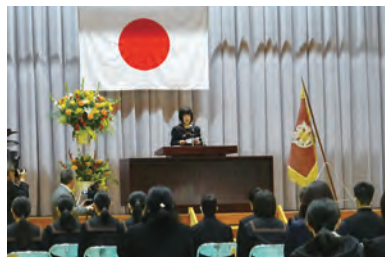
在校生による送辞

トがありました。卒業式に参加することが叶わなかった在校生ですが、何かしらの形で卒業生に感謝を伝え、祝福したいと企画したそうです。