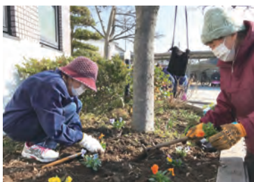
岩城観光センター（港務所）

ました。町民の方だけでなく町外からお越しになる多くのお客様にもお楽しみいただける春の準備が整いました。