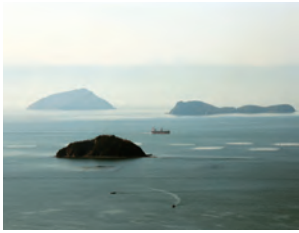
切石山(福山市内海町横島)から望む島々 (手前:百貫島、後方左:高井神島、後方右:豊島)