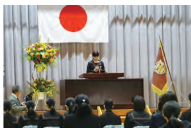
卒業生による答辞