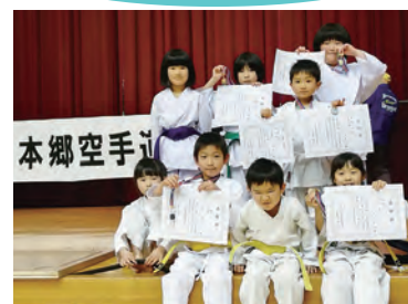
第24回本郷空手道選手権大会 2月23日(日) / 三原市