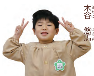
木谷 悠馬 はるま