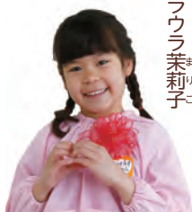
アバロス・ビイジャルバ・ラウラ 茉莉子