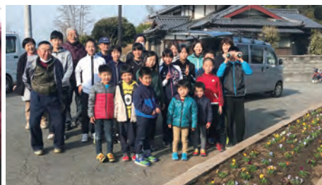
西部地区ロータリー