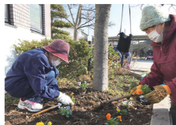
岩城観光センター (港務所)

各種団体や地元ボランティアの方々にご協力いただき、岩城島の玄関口である岩城港務所周辺などがきれいに整備され