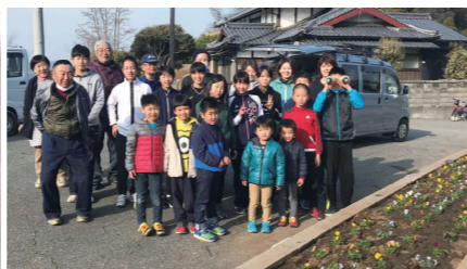
西部地区ロータリー

ました。町民の方だけでなく町外からお越しになる多くのお客様にもお楽しみいただける春の準備が整いました。