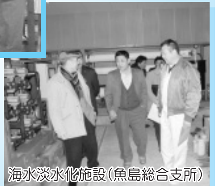
海水淡水化施設(魚島総合支所)