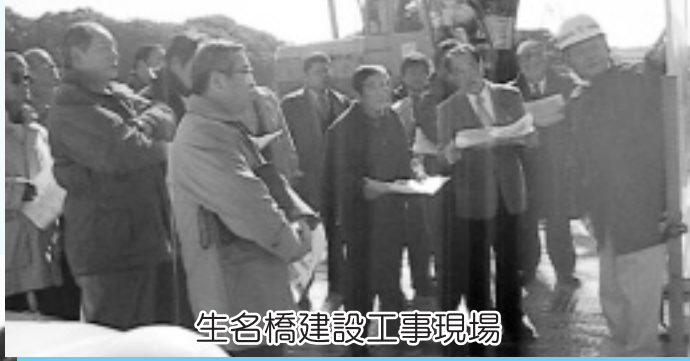
生名橋建設工事現場