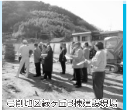
弓削地区緑ヶ丘B棟建設現場