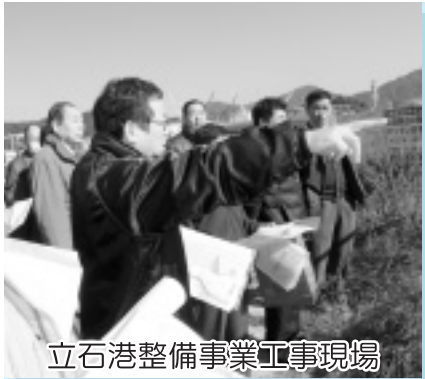
立石港整備事業工事現場

〒794-2592 愛媛県越智郡上島町弓削下弓削210番地 TEL 0897-77-2500