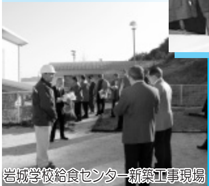
岩城学校給食センター新築工事現場